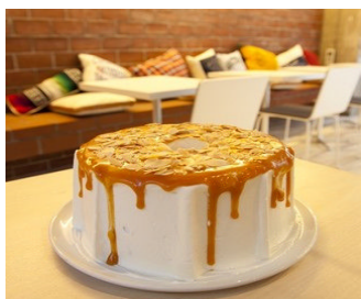
マーサービス (恵比寿)