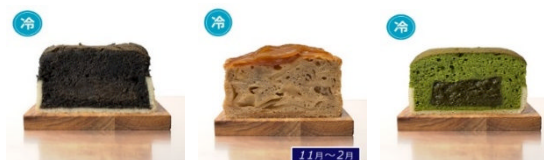
エスモニアガーデン (代官山)