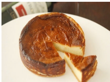
ル ラピュタ (西葛西)