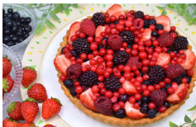
フリップス (西永福)