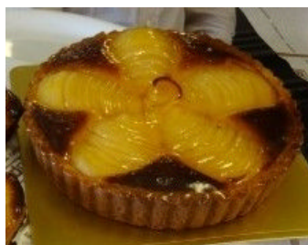
パティスリービガロー (桜新町)