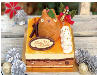
白髭のシュークリーム工房 (世田谷代田)